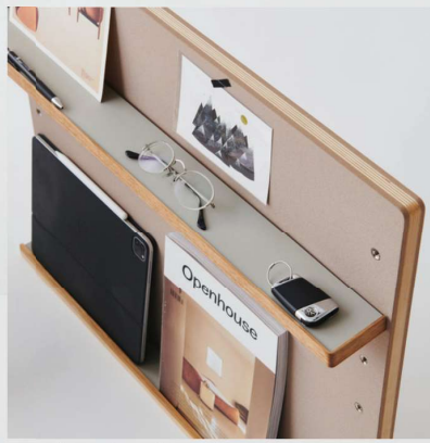
デスクパーティションS.L