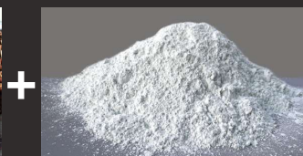
ポルトランドセメント