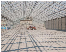
天日乾燥で水分を飛ばすローテク製法