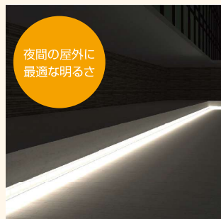
ルーチ・パワーフレックス 100V L+ 289 lm/m