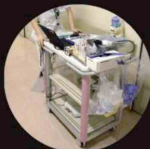
医療機関等でのワゴン