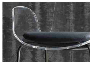
外部使用可能な素材のオリジナルクッションで座り心地は更に快適に。