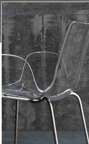
3次曲線による成型で花びらのような滑らかな曲線を表現