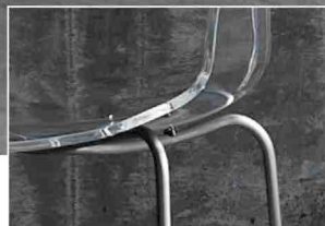
アクリルの透明感を上品に引き立てるステンレス(ヘアライン加工)のフレーム