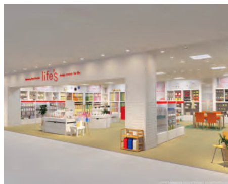
衣料品店、生活雑貨店など