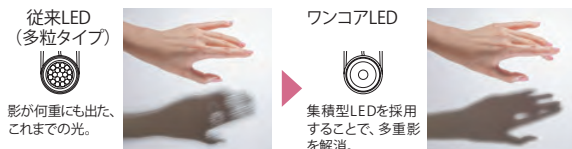
従来LED (多粒タイプ) 影が何重にも出た、これまでの光。