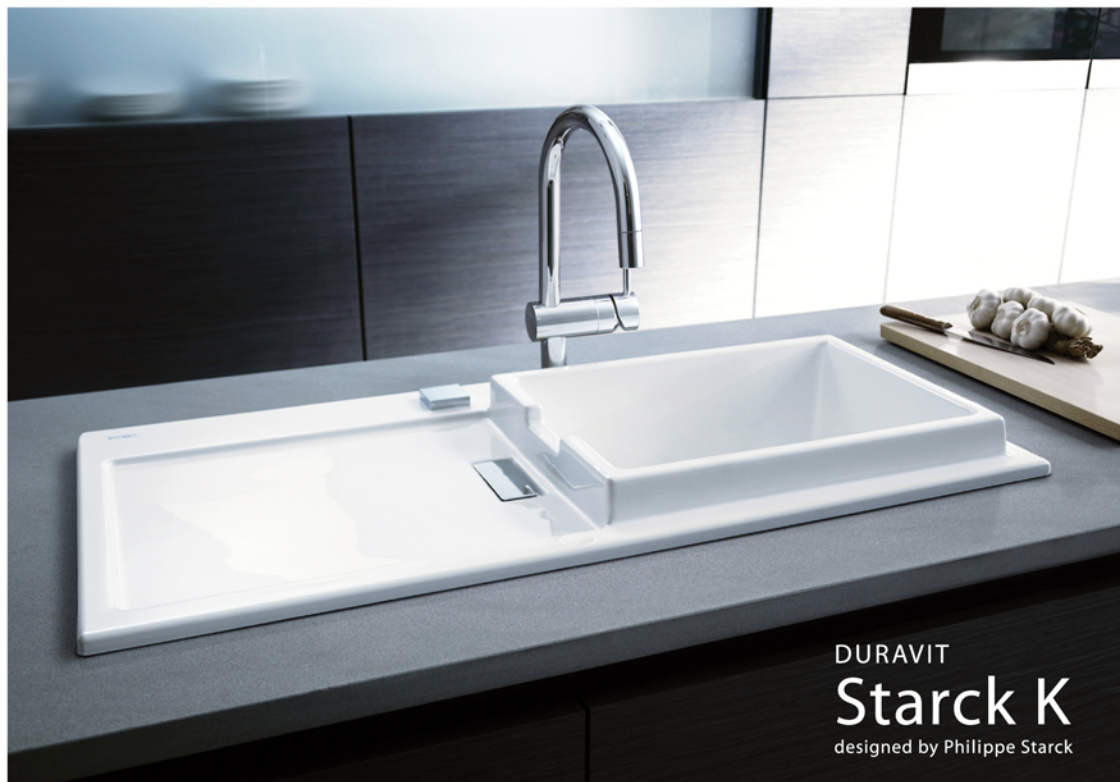
DURAVIT Starck K designed by Philippe Starck