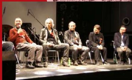
50周年イベント:名村造船所大阪工場跡にて開催