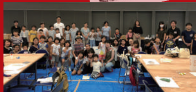
クリスマスイベント