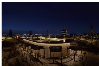
ザ・ホテル青龍 京都清水