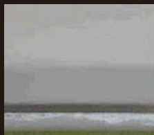
インターロック部にわずかに白錆の発生が見られる