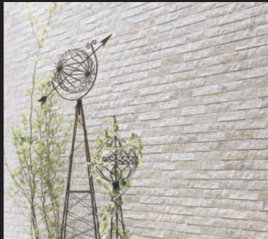
ミラベルストーン調

小さなシリカ粒子がつくる水分子膜によって外壁に直接汚れが付きにくく、雨などで汚れを落ちやすくするナノ親水マイクロガード。