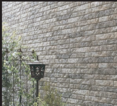
グラナダストーン調