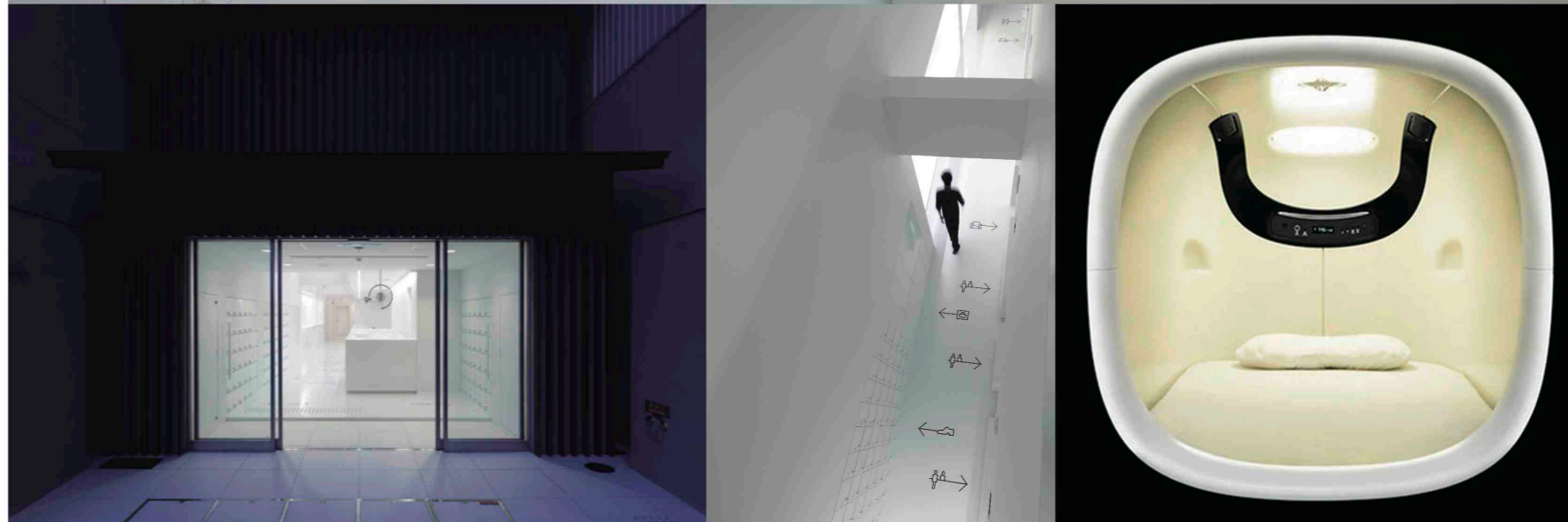
写真: JCD DESIGN AWARD 2010 大賞 ナインアワーズ 京都寺町 デザイナー: 柴田文江 / 廣村正彰 / 中村隆秋